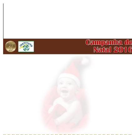
Apresentação de Power point